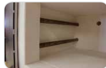
Topná tělesa v trubkách z křemenného skla