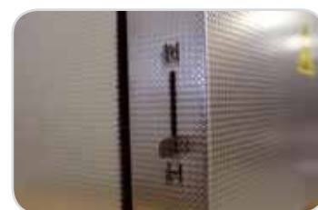
Šoupátko ve dveřích pece