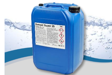
Sanosil Super 25

Naproti tomu Sanosil může účinně eliminovat jak biofilmy, tak bakterie VBNC.