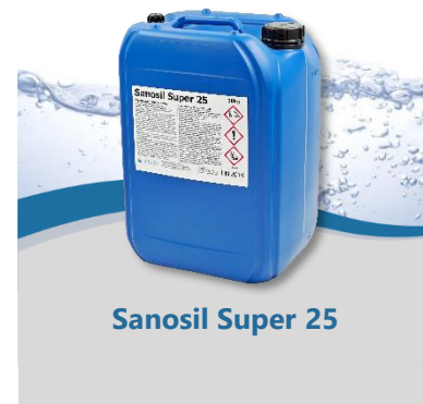
Sanosil Super 25

Poznámka: Zvýšená dávka dezinfekčního prostředku se přidává sporadicky do kontaminovaného systému během postupu šokové dezinfekce. To se provádí pro akutní eradikaci bakterií a odstranění biofilmů.