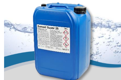
Sanosil Super 25